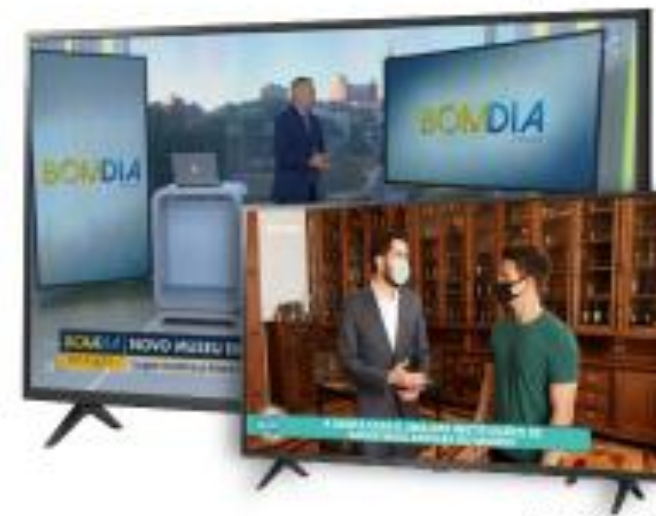
Estúdio C Rede Globo – 17/10/2020